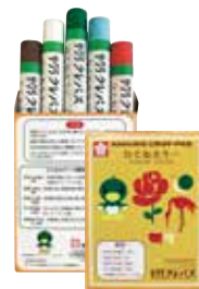
彦根総合高等学校 ひこねカラークレパス