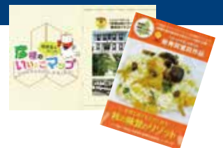
彦根東高等学校・彦根総合高等学校 観光ガイドブック カフェメニュー