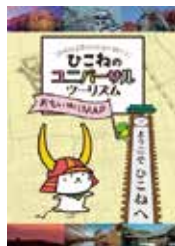
彦根総合高等学校 ひこねのおもいやりMAP